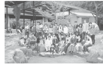
ラブ・オレバーベキュー