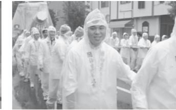
神宮式年遷宮お木曳