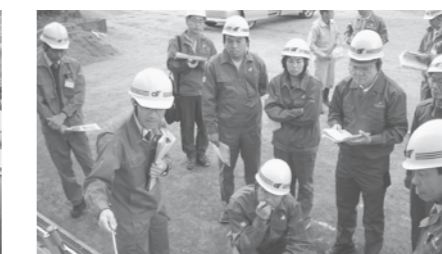
台風18号災害現地調査