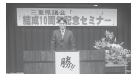
新政みえ結成10周年セミナー