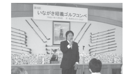
第5回いながき昭義後援会ゴルフコンペ