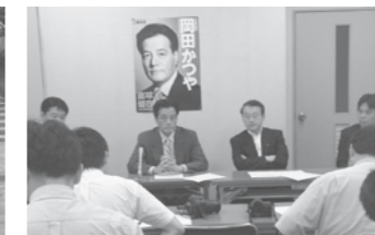
四日市港提言記者会見