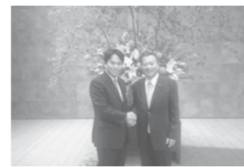
芝博一参議院議員と首相官邸