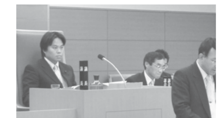
四日市港管理組合協議会議長