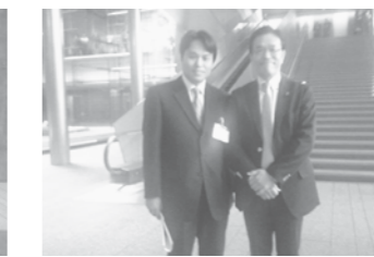
高橋千秋参議院議員と首相官邸