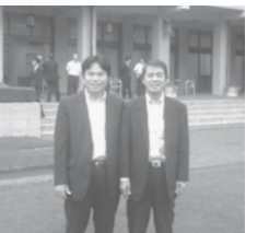
荻野新政みえ代表と参議院議長官邸