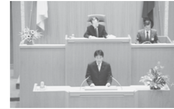
政策防災常任委員長 報告