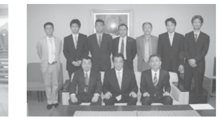
岡田克也外務大臣と外務大臣室