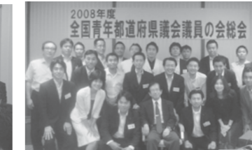
全国青年都道府県議の会