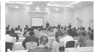
未来創造セミナー開催