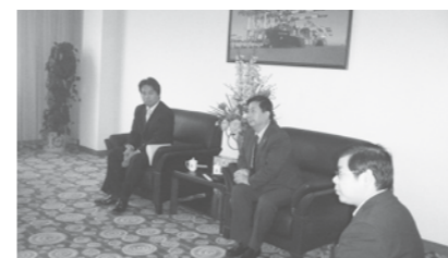
四港議長として上海港公式訪問