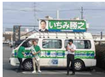
いちみ勝之知事候補の応援