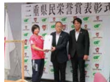
東京五輪レスリング金の向田真優選手に県民栄誉賞