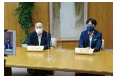
正副議長から県民の皆さんへ動画配信