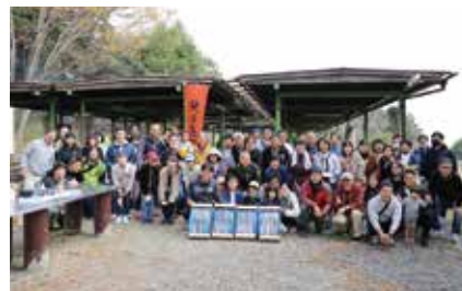
今年もさんまパーティー開催