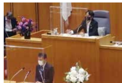
本会議場にて議長として議事進行