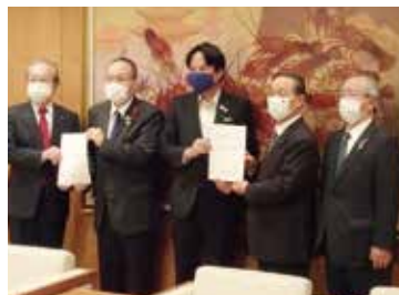
各自治体の要望対応