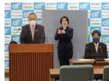
正副議長定例会見