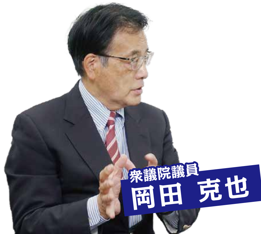
衆議院議員 岡田 克也